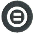
인권 HUMAN RIGHTS